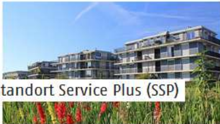
Standort Service Plus (SSP)

› hier sind auch die Landesgruppen der Sparte und eine Verlinkung zur Website des Fördervereins hinterlegt: